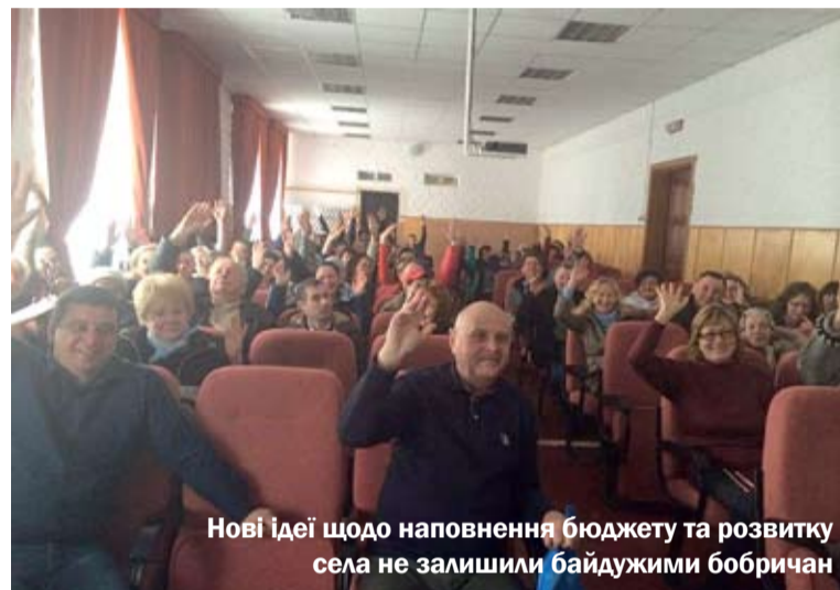
Нові ідеї щодо наповнення бюджету та розвитку села не залишили байдужими бобринчан

працівників сільради, оплата енергоносіїв та утримання суспільних будівель, прибирання вулиць, в першу чергу. Далі, якщо кошти залишаються, то громада може витратити їх на облаштування свого населеного пункту: ремонт і облаштування дорожнього покриття, встановлення освітлення, будівництво тротуарів тощо.